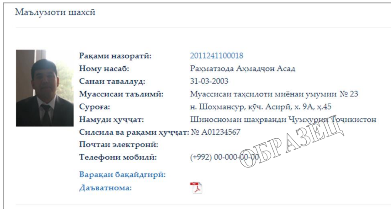
Рисунок 6.5. Окно «Личная информация»

В окне «Личная информация» (Рисунок 6.5.), которое появляется как главная страница после входа в личный кабинет, расположены Ваши личные данные (фотография, контрольный номер, ФИО, дата рождения, образовательное учреждение, адрес, вид документа, подтверждающего личность (серия и номер), адрес электронного почтового ящика и номер мобильного телефона). Также в этом окне даётся ссылка на электронные копии Регистрационного и Пригласительного листов (в файле формата «.pdf»), которые могут быть сохранены и распечатаны. Личная информация и копия Регистрационного листа будут доступны непосредственно после того, как личный кабинет станет активным (в течение дня), копия Пригласительного листа – после завершения соответствующего периода регистрации и, если имела место быть, перерегистрации.