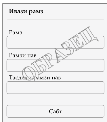
Рисунок 6.4. Окно замены пароля для входа в личный кабинет

Если Вы забыли пароль для входа в личный кабинет, восстановить его можно двумя способами: посредством Вашего электронного почтового ящика или службы коротких сообщений (SMS) . Поэтому не забудьте указать адрес Вашего электронного почтового ящика и/или номер мобильного телефона на регистрации и обеспечьте их доступность.